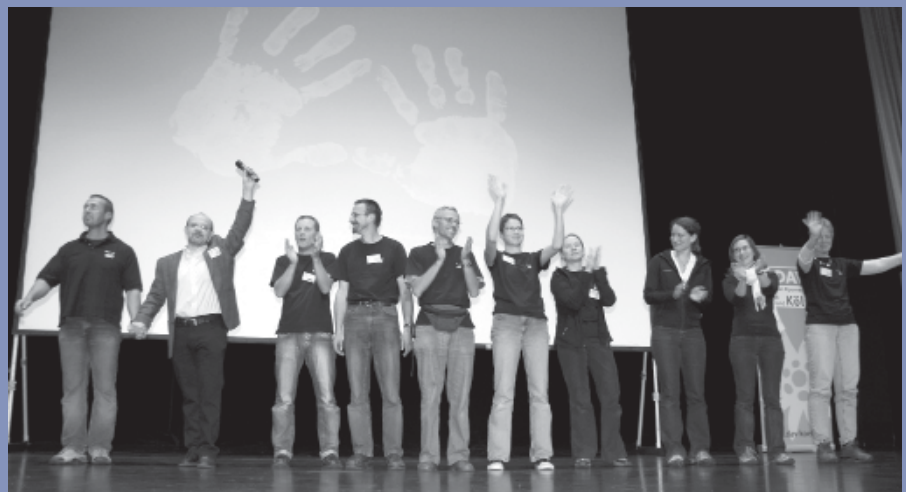
Abb.: Das AlpinTag-Team nimmt Abschied