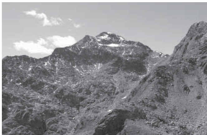
Abb.: Der Furgler, Hausberg am Kölner Haus